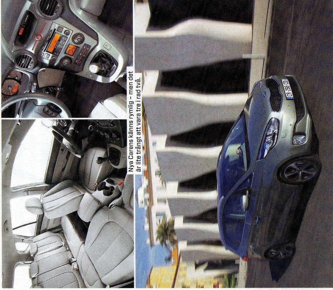
Nya Carens känns rymlig – men det är lite trångt att vara tre i rad två.